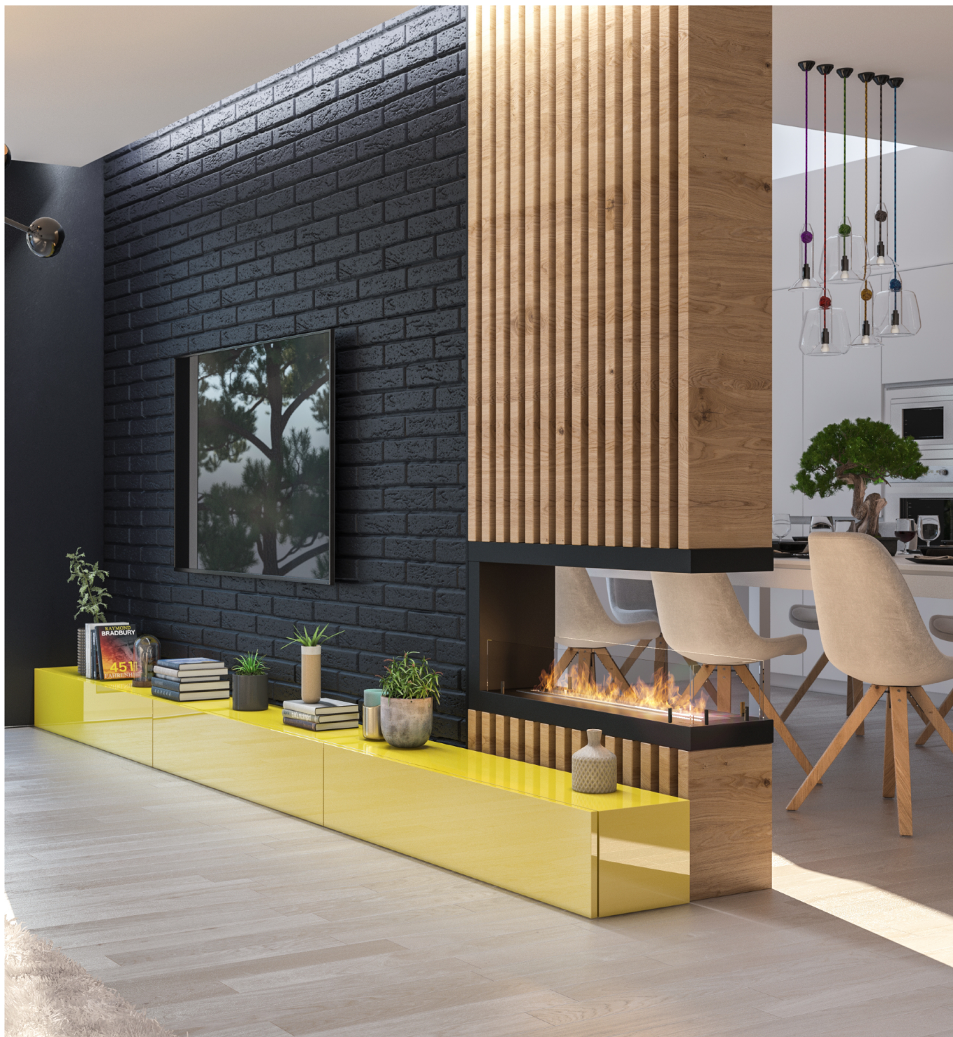
Biokominek Inside U1000.2